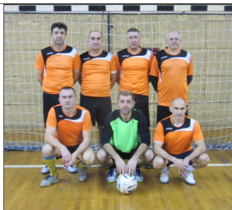
NK Vojnić 95