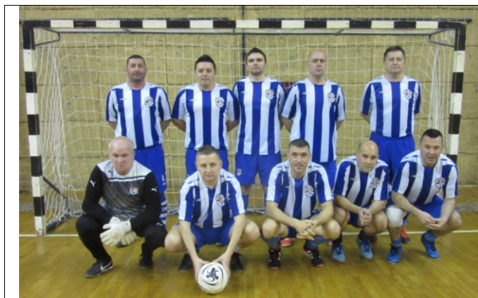
VNK Duga Resa